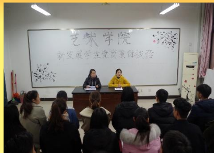
新发展党员集体谈话