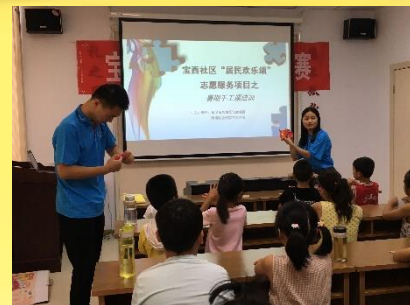
党员志愿服务活动

四是引 ：引是要引导全体学生转变观念，引导学生干部转变工作作风，引导基层党支部和党员发挥作用。