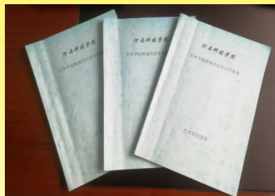
特别关注学生登记表