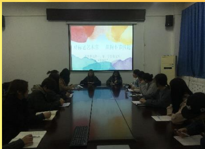
学生党支部主题党日活动