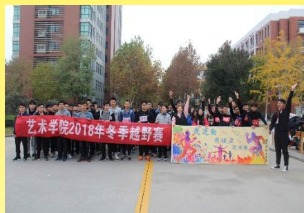
参与学生集体活动

一是访： 访就是深入到学生学习生活工作的环境中去，到教室，到宿舍，到团学活动的各个活动现场去看、去听、去观察。